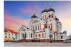
โบสถ์อเล็กซานเดอร์ เนฟสกี

19.35 น. ออกเดินทางสู่อิสตันบูล เที่ยวบิน TK1424