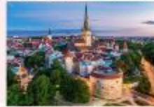
Tallinn Old Town